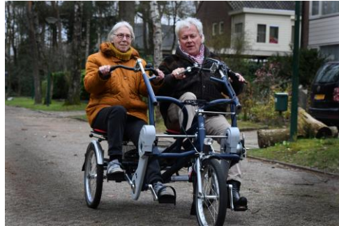
Fietsen met een vrijwilliger

Precies in een week dat het prachtig weer was, hield de accu ermee op. Die viel gelukkig nog onder de garantie, dus hij is opgestuurd en we kregen een week later een nieuwe. Het schijnt dat de accu's erg gevoelig zijn. Daarom halen wij hem altijd binnen en laten hem nooit op de fiets zitten. Desondanks ging het dus toch mis.